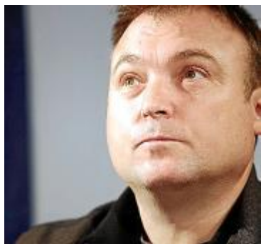
С 2007 года Барсело – почётный доктор Университета Балеарских островов.

дожник часто обращается к теме природы. В Испании и Франции Барсело считается законным наследником великих современных испанских мастеров, таких как Пабло Пикассо (Pablo Picasso) и Антони Тапиес (Antoni Tàpies). В 2003 году