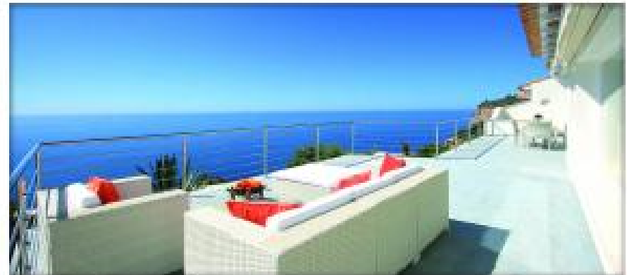
PTO. ANDRATX – LA MOLA – Презентабельная роскошная вилла в 1-ой морской линии Участок 1.000 м 2 , жилая площадь 300 м 2 , 4 спальни вкл. 2 гостевых апартаментов, 4 ванных, террасы, бассейн, кондиционер, камин Реф. № 6061, € 3.650.000