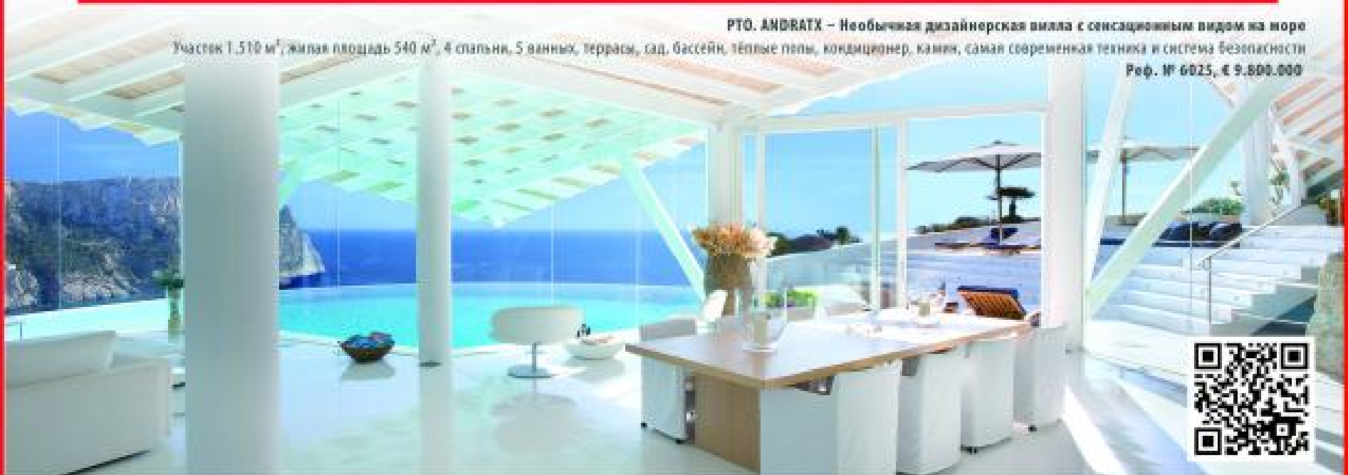
PTO. ANDRATX – Необычная дизайнерская вилла с сенсационным видом на море Участок 1.510 м 2 , жилая площадь 540 м 2 , 4 спальни, 5 ванных, террасы, сад, бассейн, тёплые полы, кондиционер, камин, самая современная техника и система безопасности Реф. № 6025, € 9.800.000