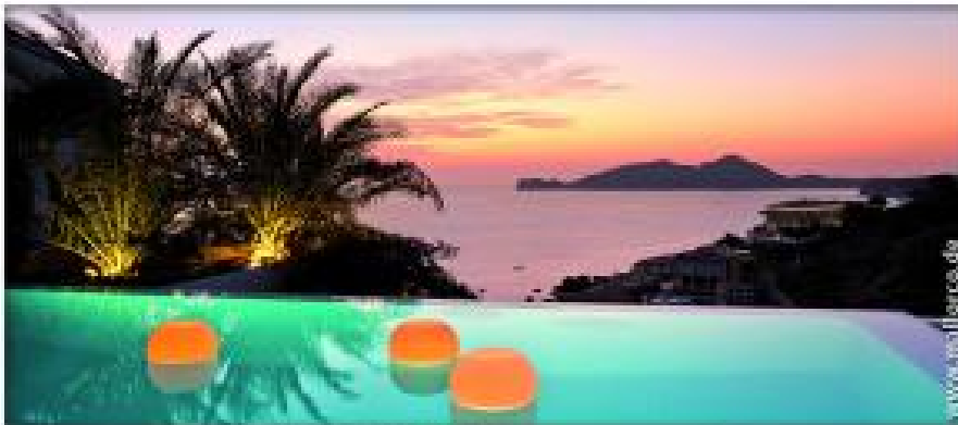
PTO. ANDRATX – LA MOLA – Средиземноморский флер Участок 648 м 2 , жилая площадь 170 м 2 , 3 спальни, 3 ванных, террасы, бассейн, гараж (21 м 2 ), тёплые полы, кондиционер, акустическая система, вкл. весь инвентарь Реф. № 6239, € 2.950.000