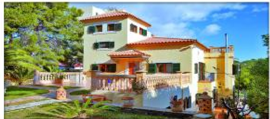
PORTALS HOUSS – Средиземноморская вилла с доступом на пляж – 1-ая морская линия Участок 1.080 м 2 , общая площадь 380 м 2 , офис, 5 спален, 4 ванные, террасы, сад, бассейн, отопление, кондиционер, камин Реф. № 4167, € 3.450.000