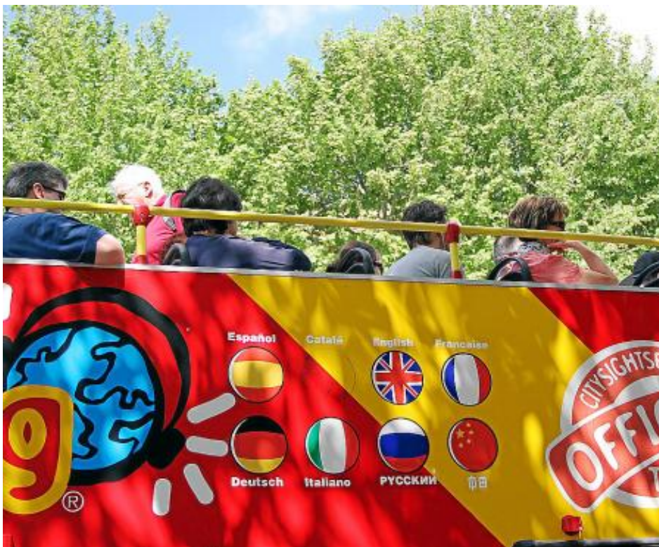
Теперь и по-русски: экскурсионная программа в автобусе Palma City Sightseeing (вверху); ресторан Ca n' Eduardo – меню и обслуживание (справа).