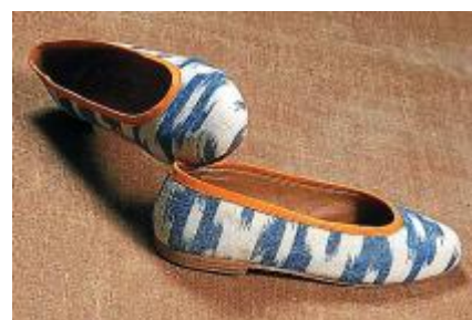
Пляжная сумка, платья и другие изделия из тканей llengües по эскизам Фионы Виндиш.