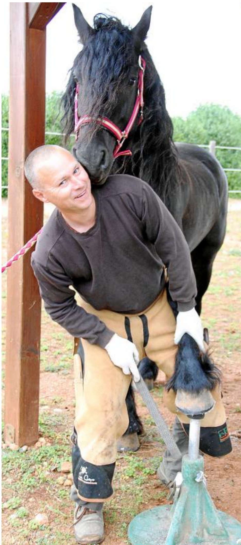
Близость к животным: Благодаря занятию йогой кузнец научился снимать напряжение, чувствуемое лошадьми.

После того, как в 1991 году открылись границы в