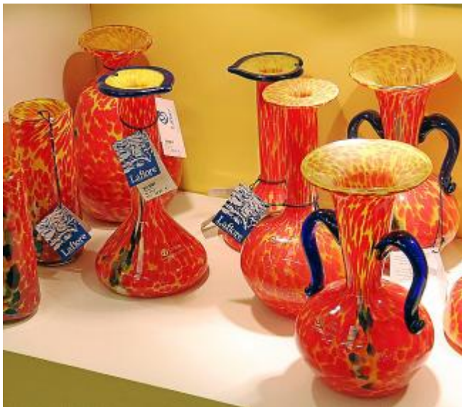
В магазине на фабрике представлен большой выбор декоративных и столовых предметов (вверху). Русские покупатели предпочитают красный цвет – популярная коллекция (слева).