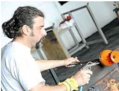
Мастер выдувает шар из раскалённой массы (вверху) и вручную дорабатывает изделие (слева). Окрашивание – кобальт и охра (справа).