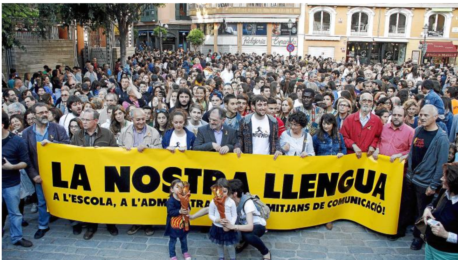
В поддержку каталонского языка: в субботу, 4 мая, в Пальме на улице вышли 4 тыс. демонстрантов.