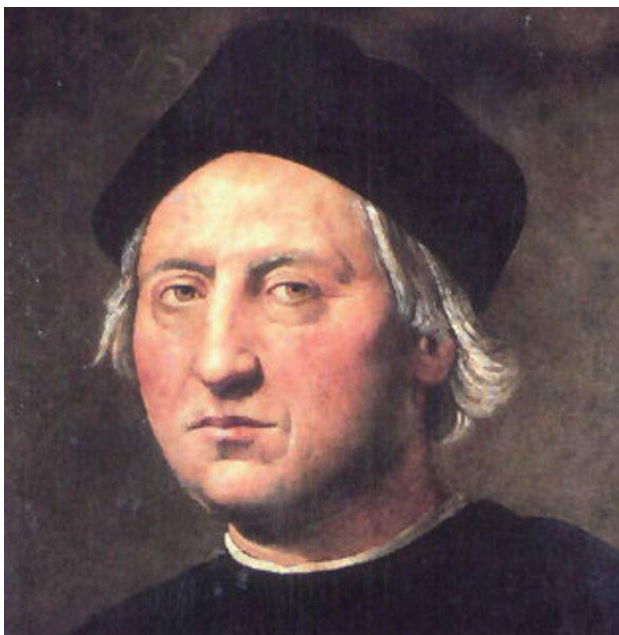
Внешний облик Колумба известен по портретам, написанным уже после его смерти.