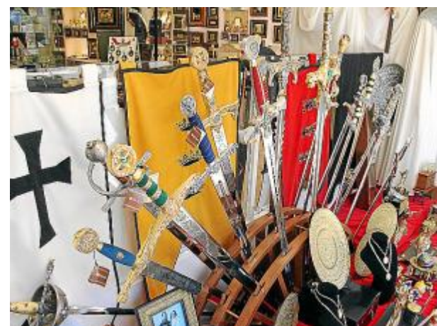
Инкрустированные вручную воинские доспехи так же как и в 16 веке поражают своей красотой