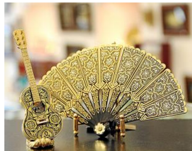
В магазине можно приобрести оригинальные подарки и сувениры для своих родных и близких