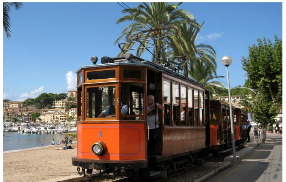
Трамвай между Сольер и Порт-Сольер был введён в эксплуатацию в 1913 году