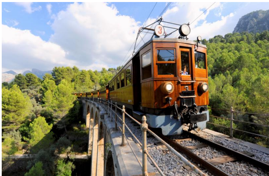
Путешественники могут приблизиться к самому сердцу Серра-де-Трамунтана

Адрес: Eusebio Estada, 1, 07004, Пальма-де-Майорка Телефон: 971 75 20 51 / 971 75 20 28