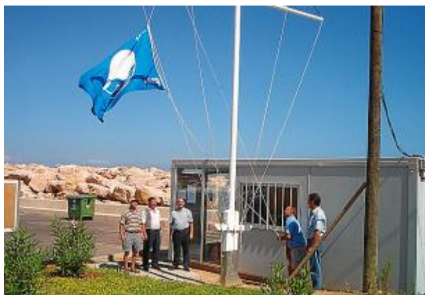
Пляжи округов Кальвии и Андрача подтвердили чистоту воды в этом году

Наряду с пляжами флагами были удостоены различные спортивные порты, а также прогулочные катера для туристов. Отмечается, что всего на Балеарских островах этим летом будут развеиваться 67 голубых флагов.