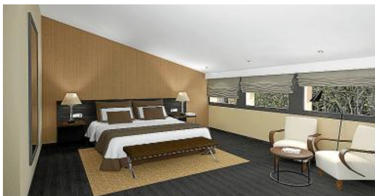
Бутик-отель Can Alomar в центре Пальмы был признан одним из лучших отелей Испании

Президент ассоциации отельеров Хавьер Виш считает, что экономический кризис послужил толчком для этого бума. В то время цены на подобную недвижимость настолько снизились, что владельцы отелей поспешили инвестировать. По словам Виша, в среднем гостиничный номер обходится, включая покупку недвижимости и ремонт, в 300 тыс. евро. Это составляет около 6 млн евро.